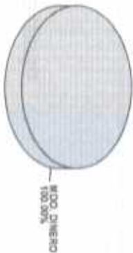
Distribución del Patrimonio